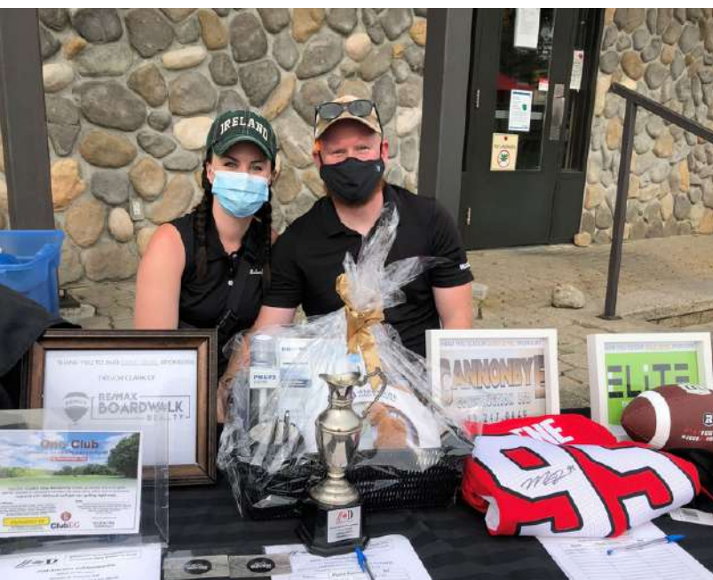
Tournoi de golf de bienfaisance de Dynes Sports

NOUS SOMMES RECONNAISSANTS à nos donateurs fondateurs, aux Héros Corporatifs de la RNation, aux commanditaires des événements et aux participants, aux partenaires communautaires, aux donateurs individuels et d'entreprises, à ceux et celles qui soutiennent les tirages 50/50 et à l'Ottawa Sports and Entertainment Group (OSEG) pour leur généreux soutien financier. Chaque don offre aux enfants et aux jeunes la possibilité de jouer, d'apprendre et de s'épanouir grâce au sport.