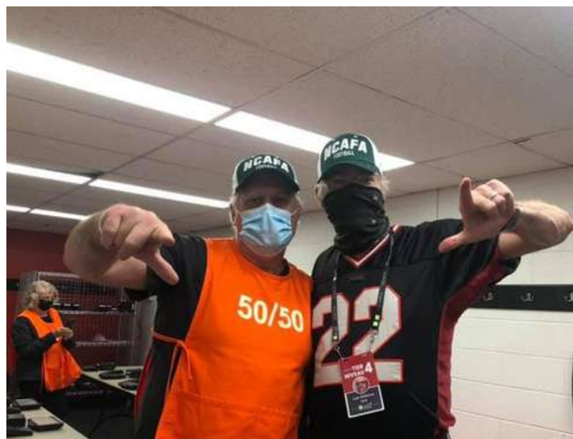
Vendeurs NCAFA 50/50 2021