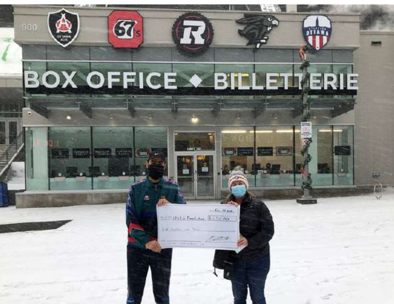
Collège Algonquin - Études en récréation et loisirs 2021