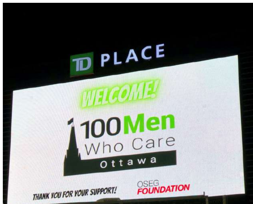
100 Men Who Care à TD Place, septembre 2021